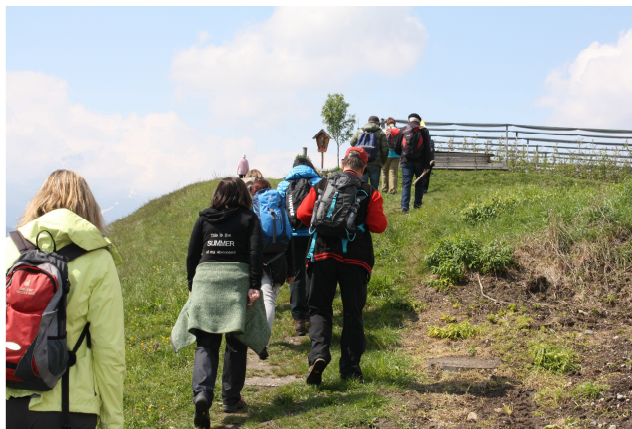
Petrus Canisius Wanderung, 29.04.2017