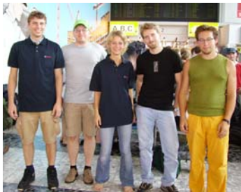
Abflug am 12. Juli 19:20 Wien

NUN IST ES SOWEIT! Die ersten fünf Volontäre flogen von Wien am 12. Juli über Madrid nach Quito. Die weiteren acht Volontäre aus der MK-Innsbruck fuhren in der Nacht auf 16. Juli nach München, um in zwei Gruppen nach Quito zu fliegen.