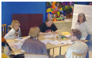
Spanisch-Intensivkurs 5.+ 6. Juni

Zweckgebunden sind zwei Spenden zu je € 400,- für Hogar de Cristo und SIGVOL zur Häuser-Zwischenfinanzierung. (s. 1. Newsletter)