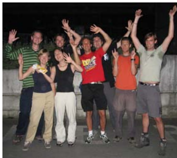
Abfahrt am 16. Juli um 3:00 von Innsbruck zum Flughafen München.